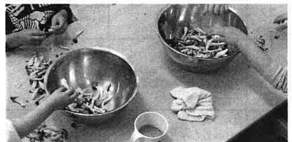
↑ どんぶりごみ きのことこき