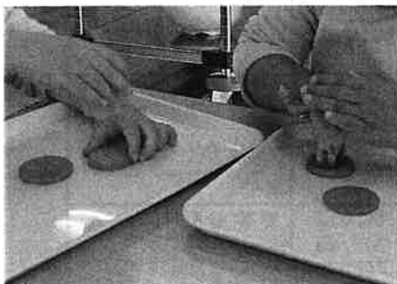
↑ ちゅうりっぷごみ 人参の型抜き