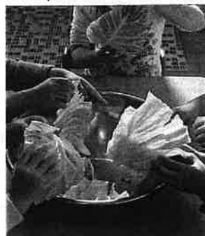
ちゅうりっぷごみ ↓ キャベツちぎり